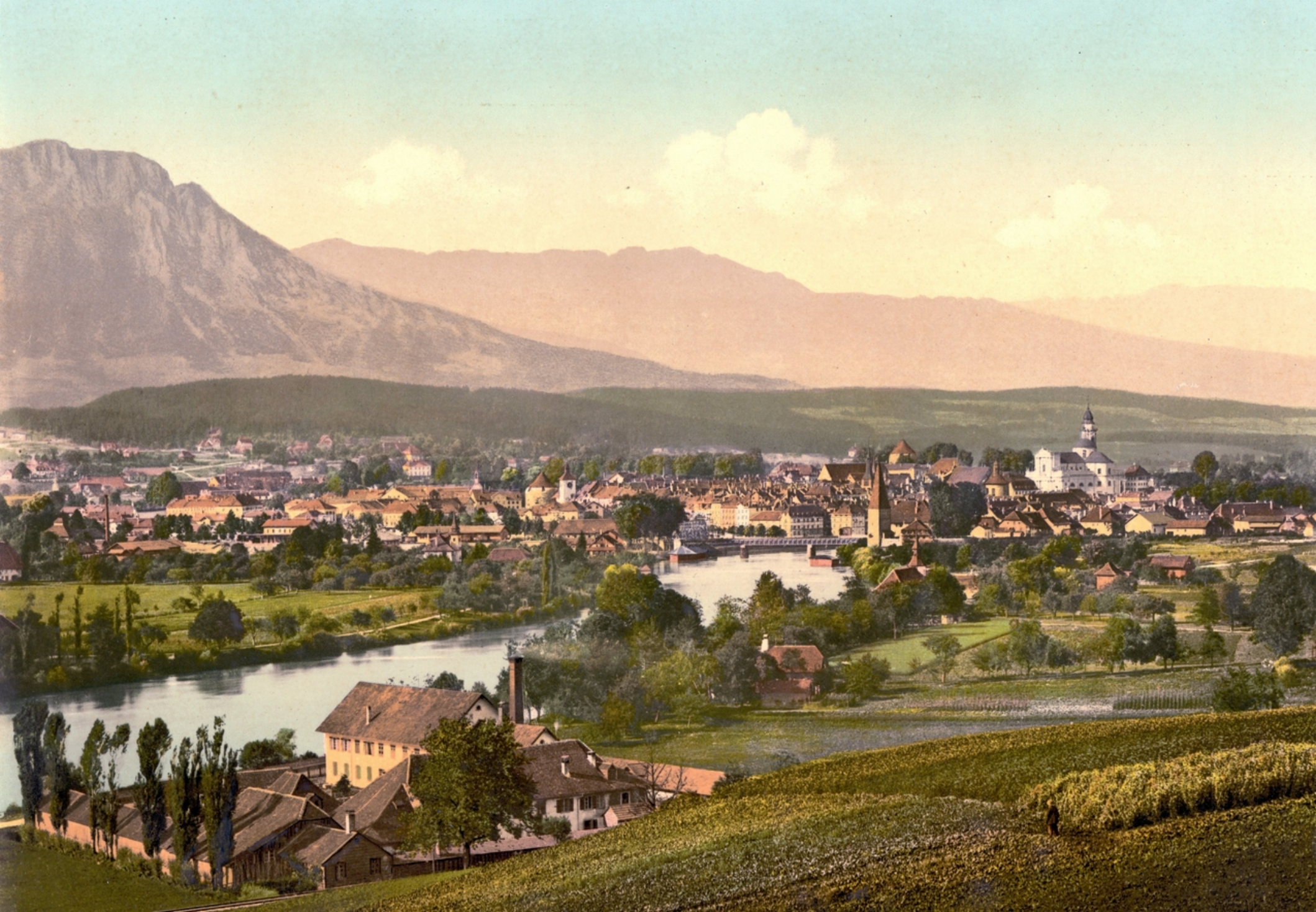
Anblick von Südosten um 1900 .